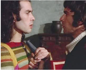
1971 LA VICTIME DÉSIGNÉE (La vittima designata) de M. Lucidi avec Pierre Clémenti