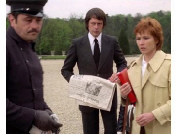
1975 FOLLE À TUER d'Yves Boisset avec Victor Lanoux, Marlène Jobert