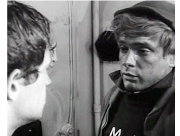
1963 LA MER À BOIRE (Mare Matto) de Renato Castellani avec Jean-Paul Belmondo