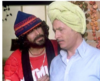
1979 LE COUCOU (Il Lupo è l'Agnello) de Francesco Massaro avec Michel Serrault