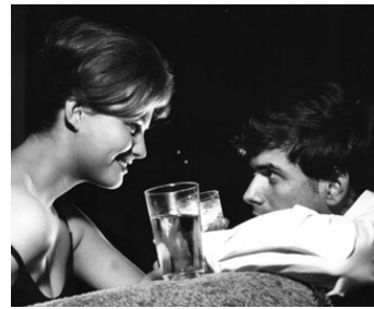
1960 LES DAUPHINS (I Delfini) de Francesco Maselli avec Claudia Cardinale