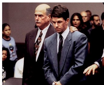
1999 THE YARDS (The Yards) de James Gray avec Mark Wahlberg