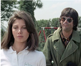
1974 LA RANÇON DE LA PEUR (Milano odia) d'Umberto Lenzi avec Laura Belli