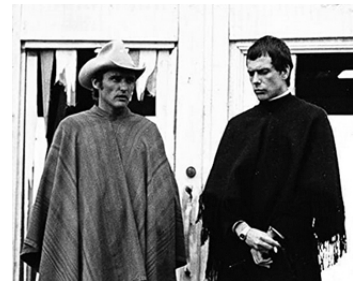
1970 THE LAST MOVIE (The last Movie) de et avec Dennis Hopper