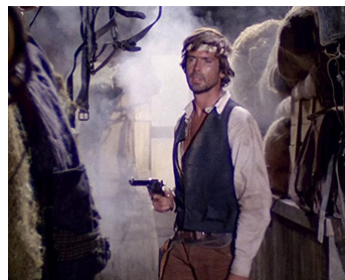
1967 TIRE ENCORE SI TU PEUX (Se sei vivo spara) de Giulio Questi