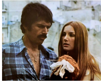
1972 LA LONGUE NUIT DE L'EXORCISME de Lucio Fulci avec Barbara Bouchet