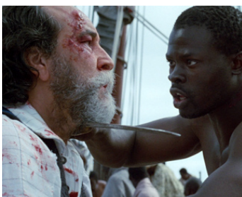
1997 AMISTAD (Amistad) de Steven Spielberg avec Djimoun Hounsou