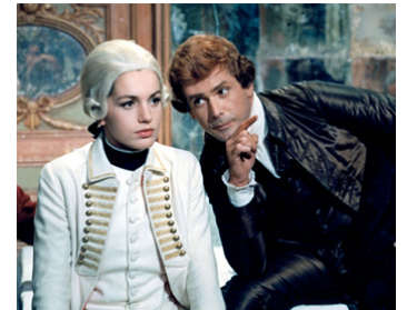
1965 LE CHEVALIER DE MAUPIN (Madamigella di Maupin) de M. Bolognini avec C. Spaak