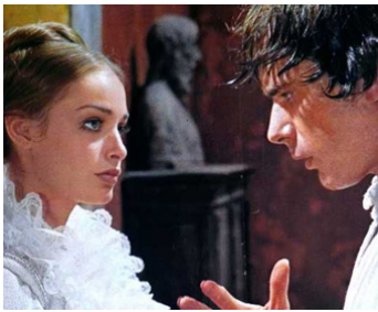
1969 LIENS D'AMOUR ET DE SANG (Beatrice Cenci) de Lucio Fulci avec Adrienne Larussa