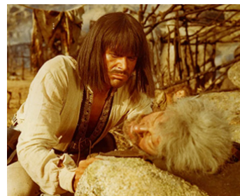
1967 LE DERNIER FACE À FACE (Faccia a Faccia) de Sergio Sollima avec Francisco Sanz