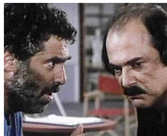
1988 LE ROI BLESSÉ (Gioco al massacro) de Damiano Damiani avec Elliott Gould