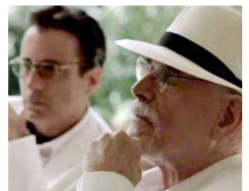
2004 ADIEU CUBA (The lost City) d' Andy Garcia avec Andy Garcia