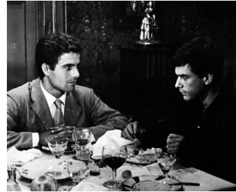
1961 JOUR APRÈS JOUR (Giorno per giorno disparamente) d'A. Giannetti avec N. Castelnuovo