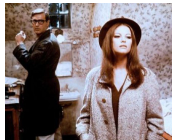
1968 UN COUPLE PAS ORDINAIRE (Ruba al prossimo tuo) de F. Maselli avec C. Cardinale