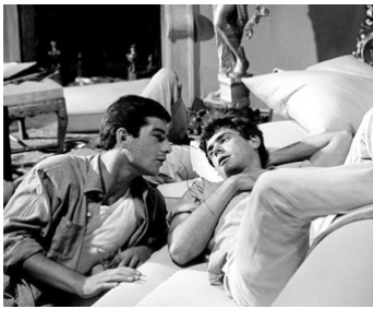
1959 LES GARÇONS (La Notte brava) de Mauro Bolognini avec Jean-Claude Brialy