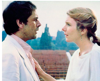
1978 LA LUNA (La Luna) de Bernardo Bertolucci avec Jill Clayburgh