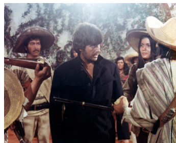
1968 SALUDOS HOMBRES (Corri, uomo, corri) de Sergio Sollima avec Chedo Alonso