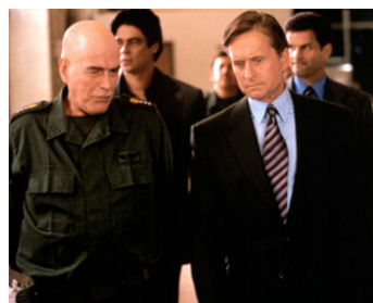
1999 TRAFFIC (Traffice) de Steven Soderbergh avec Michael Douglas