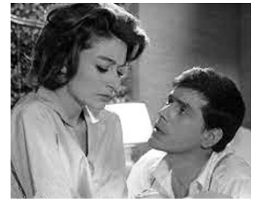
1960 L'IMPRÉVU (L'Imprevisto) d'Alberto Lattuada avec Anouk Aimée