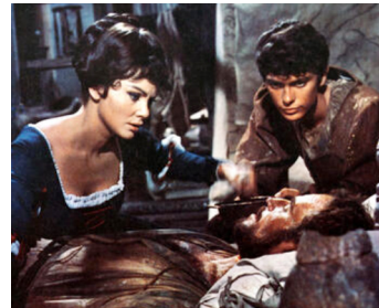
1965 L'EXTASE ET L'AGONIE (The Agony and the Ecstasy) de C. Reed avec D. Cilento, Ch. Heston