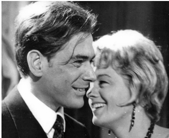
1964 LES DEUX RIVALES (Gli Indifferenti) de Francesco Maselli avec Shelley Winters