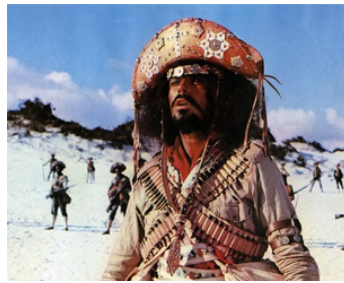
1969 O' CANGACEIRO (O Cangaceiro) de Giovanni Fago