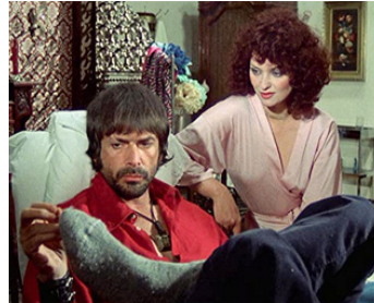
1975 BRACELETS DE SANG (Il giustiziere sfida la Città) d'Umberto Lenzi avec Femi Benussi