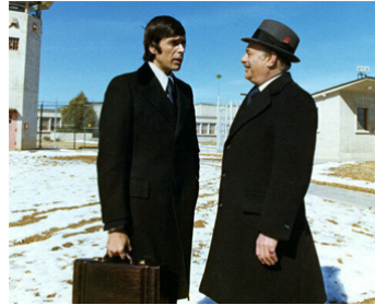
1973 LE CONSEILLER (Il Consigliori) d'Alberto De Martino avec Martin Balsam