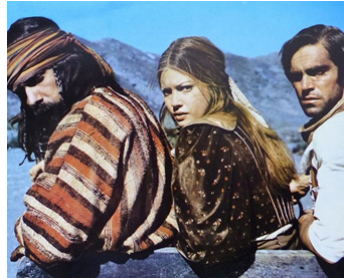
1974 LES 4 DE L'APOCALYPSE (Il 4 dell'apocalisse) de L. Fulci avec Lynne Frederick, Fabio Testi