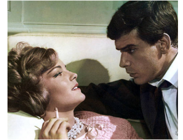
1961 BOCCACE 70 (Boccaccio 70), Il Lavoro de Luchino Visconti avec Romy Schneider