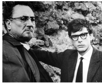
1959 LE BEL ANTONIO (Il Bell'Antonio) de Mauro Bolognini avec Pierre Brasseur