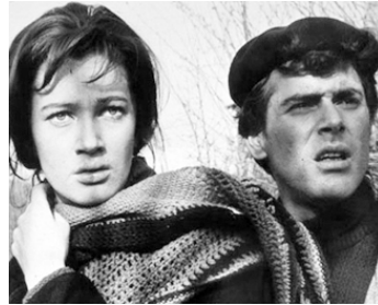
1961 LES PARTISANS ATTAQUENT À L'AUBE (Un giorno da leoni) de N. Loy avec Carla Gravina