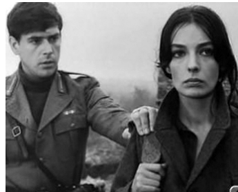
1965 DES FILLES POUR L'ARMÉE (Le soldatesse) de Valerio Zurlini avec Marie Laforêt