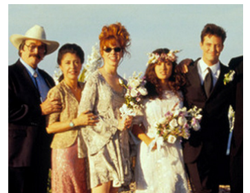
1996 COUP DE FOUUDRE ET CONSÉQUENCES d'A.Tennant avec Salma Hayek, Matthew Perry