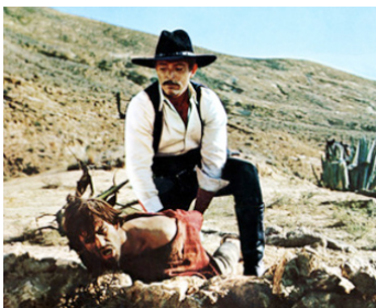
1966 COLORADO, UN MAUDIT DE PLUS (La Resa dei conti) de S. Sollima avec Lee Van Cleef