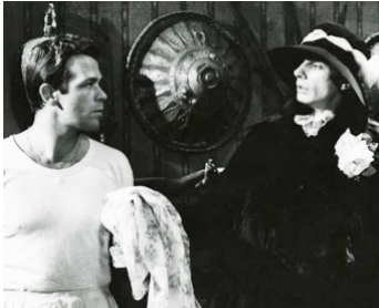
1961 LE DÉSORDRE (Il Desordine) de Franco Brusati avec Renato Salvatori