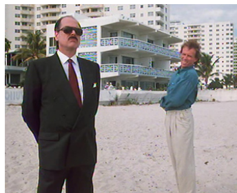
1988 CAT CHASER (Cat Chaser) d'Abel Ferrara avec Peter Weller