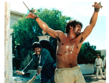
1968 TROIS POUR UN MASSACRE (Tepepa, viva la Revolucion) de G. Petroni avec R. Hernandez