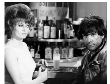
1967 LA NUIT DU GRAND MASSACRE (Crónica de un atroco) de J. Balcázar avec Anita Ekberg