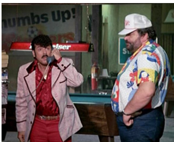
1982 ESCROC, MACHO ET GIGOLO (Cane e gatto) de Bruno Corbucci avec Bud Spencer